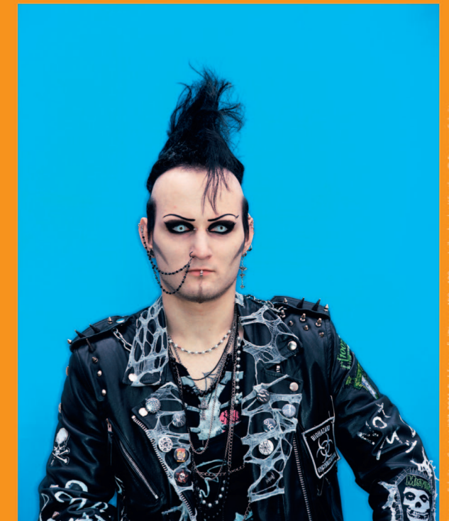
Eranus Schöler: Contest #27, 2011, Farb fotografie/Diasec, 190 x 170 cm, Leihgabe des Künstlers © Eranus Schöler

Kosten: 40 Euro inklusive 15 Euro Materialkosten pro Kind