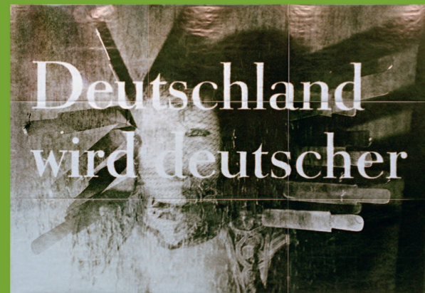
Katarina Siewering: Deutschland wird deutscher, 1993, Fünffarben-Offsetdruck, 252 x 356 cm, Plakatierung in Berlin vom 30. April bis 12. Mai 1998, U-Bahnhof Berlin Alexanderplatz, Leihgabe der Künstlerin, Foto: Klaus Metzky © VG Bild-Kunst, Bonn 2018

Dienstag, 04.09.2018, 16 Uhr Kosten: 5 Euro