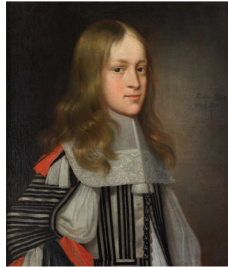
Benjamin Block (1631–1689): Der Prinz von Sachsen-Weißenfels 1663, Öl auf Leinwand, 62,3 × 55,5 cm, Kadriorg Kunstmuseum Tallin

Kuratorenführung Kriegszeiten – Soldatendasein, Joachim Säckl